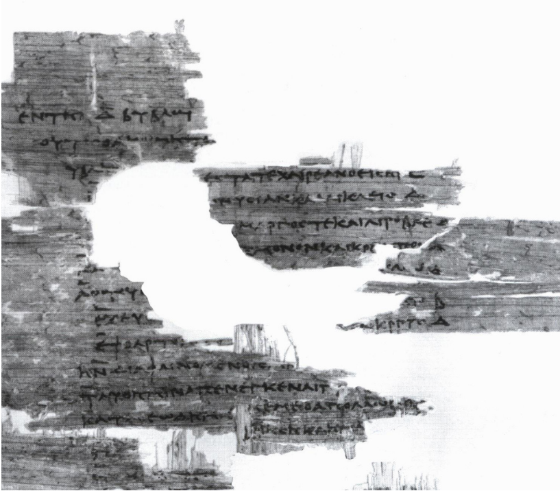
Tav. 1: fr. (a) recto